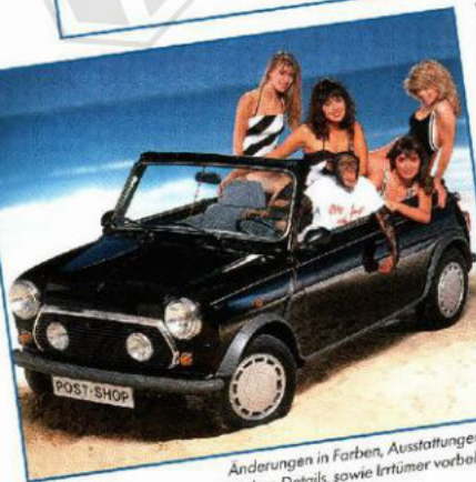
Änderungen in Farben, Ausstattungen und technischen Details, sowie Irrtümer vorbehalten.

2903 Bad Zwischenahn, Mühlenstr. 20. Tel: 04403 33 78